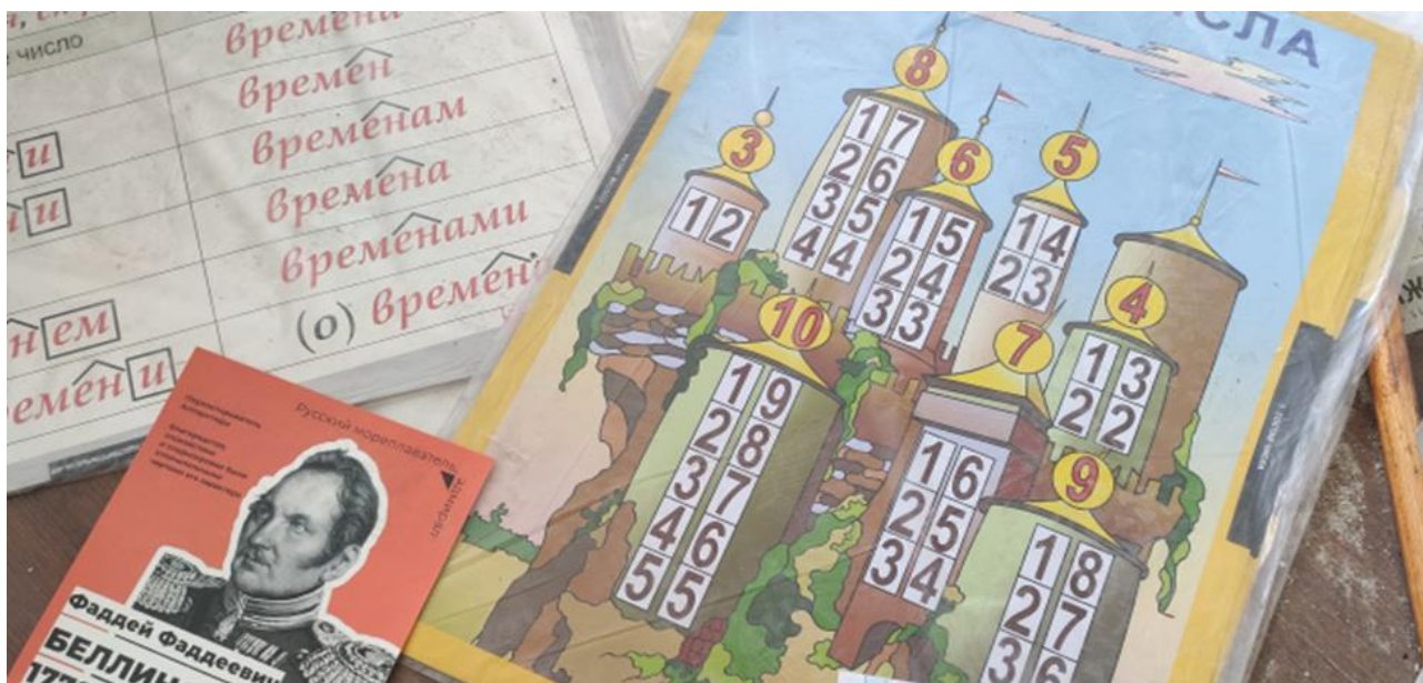
Metodiskie palīg līdzekļi, ko krievi atveda uz Harkivas apgabala pilsētu Kupjansku (okupēta līdz 2022. gada septembrim)