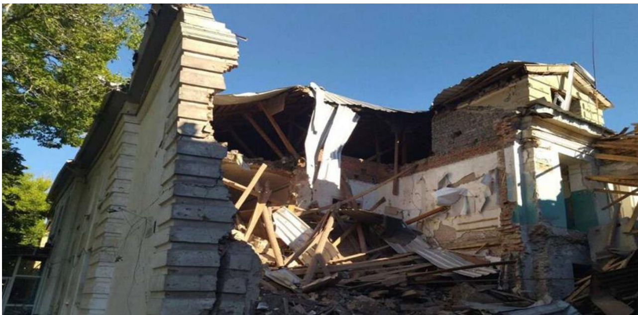
Sagrauta skola Prosjanā, Dņipropeetrovskas apgabala Sineļnikoves rajonā.

Kuras izglītības iestādes Krievija gada laikā iznīcinājusi Dņipropeetrovskas un Zaporīžjas apgabalā? Tā kā okupanti nespēj izcīnīt uzvaru kaujas laukā, viņi ķeras pie kara noziegumiem pret civiliedzīvotājiem. Ukrainas Izglītības un zinātnes ministrijas dati liecina, ka līdz 2023. gada 20. janvārim cietusi 3051 izglītības iestāde un 420 no tām pilnībā sagrautas. Gandrīz puse no šīm izglītības iestādēm ir skolas: 1259 cietušas, un 223 ir pilnībā sagrautas.