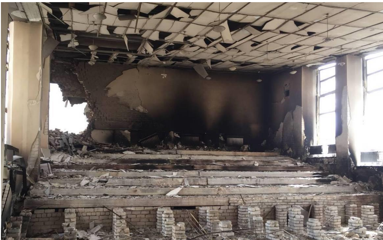
Volodimira Dāla Austrumukrainas Nacionālās universitātes auditorija pēc krievu okupantu apšaudes.