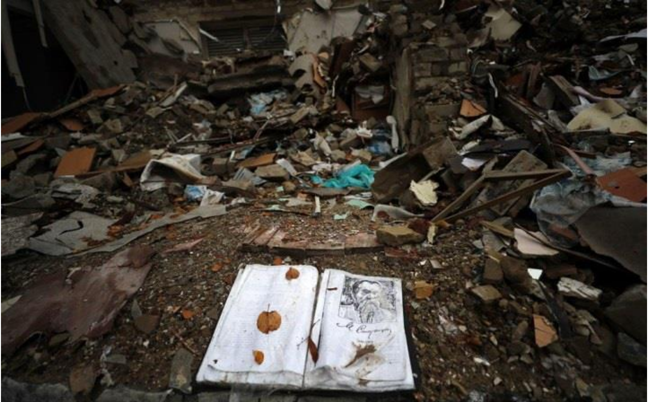
Apšaudē sagrauta skola.