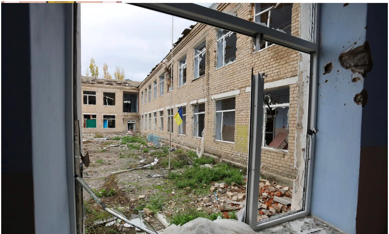
Arhanheļskas pilsētciemats Hersonas apgabalā. Iznīcināta vidusskolas ēka, kurā okupācijas laikā bija izvietoti Krievijas karavīri.

Ukrainas Masu informācijas institūts publicējis pētījumu „Kultūras genocīds: kurš un kāpēc Ukrainas okupētajās teritorijās ievieš Krievijas izglītību” . Institūta eksperti un speciālisti konstatējuši, ka Krievija izstrādājusi un Ukrainas okupētajās teritorijās ieviesusi četras izglītības „denacifikācijas” shēmas. Tās finansē no Krievijas valsts budžeta, un tās ir: krievu skolotāju „vervēšana”; kolaboracionistu „pārizglītošana” un „kvalifikācijas paaugstināšana”; galvenokārt Krievijas augstskolu pedagoģijas fakultātēs savervētu krievu studentu sūtīšana uz Ukrainu kremļa „humānajās misijās”; ukraiņu skolotāju terorizēšana.