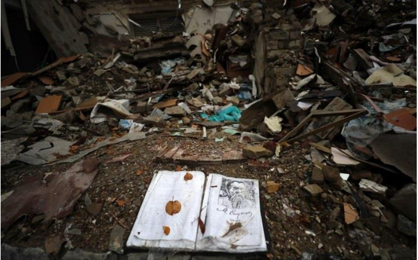
Apšaudē sagrauta skola.