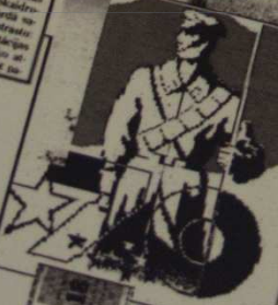
Par Suvorova ielu

Daudzas republikas sabiedriskās organizācijas, darba kolektīvi un pilsoni, kā arī Latvijas PSR Augstākās Padomes Prezidijs 1988. gada 11. jūlijā izveidotā Darba grupā priekšlikumu izskatīja un pieņēma šādu lēmumu: lai sekmētu latviešu valodas attīstību un funkcionēšanu, tai nosakāms valsts valodas statuss republikā un vienlaicīgi ievērojot arī citu tautību ledzītāju pildināšanu, kas šu akta prošu valodas un tošanu un nappriekšēnā nīgotu proizskatīšana, Padomei 3. Lat Padomei veikt šamān citu nai nān bērni veikt citu nai bērni veikt